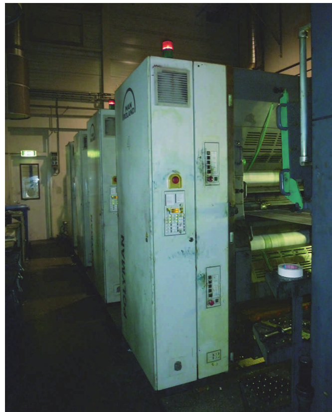
Het drukproces kan beginnen. Er is een druktoeren voor elk van de vier drukk kleuren

redacteur (René Suiker) opgezet, op basis van een aantal vaste ijkpunten in het jaar. Zo zijn er drie CompUsersdagen in het jaar. Voorafgaand aan deze evenementen komt de SoftwareBus bij de leden op de mat, zodat we onze evenementen nog wat publiciteit kunnen meegeven. Daarnaast rekenen we elk jaar op de HCC dagen. Daar willen we uiteraard ook publiciteit aan geven, want we hopen daar altijd veel van onze leden aan te treffen. Ten slotte willen we onze lezers en lezeressen graag een fijne zomervakantie en fijne feestdagen toewensen. Dit verklaart dus ook gelijk waarom