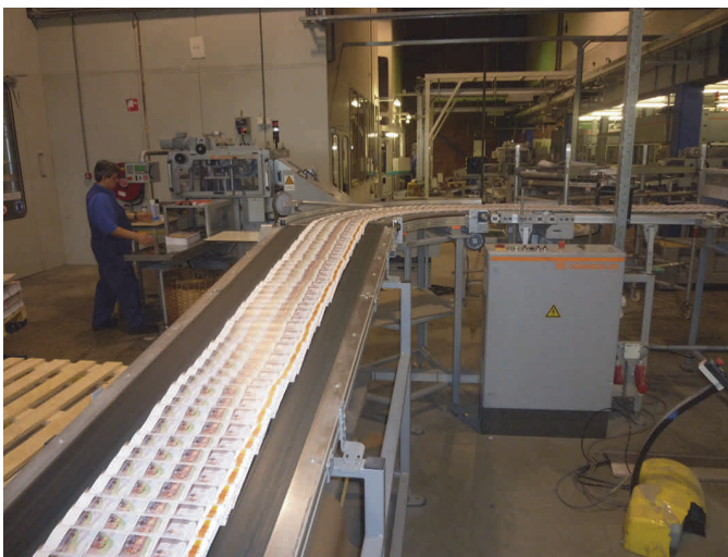
De afgedrukte en gevouwen katernen 'vliegen' je om de oren

Nadat het plan is goedgekeurd gaan we aan de slag om de SoftwareBus te realiseren. Het is de bedoeling, dat met een aantal redacteuren de inhoud van de nieuwe SoftwareBus bepaald wordt. Nou beschikt de SoftwareBus nog niet echt over veel redacteuren, er is ruimte voor meer. Vanuit de planning bezien zou het ideaal zijn als we grofweg de inhoud konden bepalen, het thema konden bepalen en vervolgens deze artikelen laten maken. Op dit moment is het samenstellen van de SoftwareBus nog een beetje een mix van bepalen welke artikelen je wilt hebben, bepalen van het thema, maar toch ook heel veel 'graaien wat je graaien kunt'. Hoewel we wel geweldig goede auteurs in ons midden hebben, hebben we wel te maken met vrijwilligers. De mate waarin je daarin sturend op kunt treden is enigszins beperkt natuurlijk.