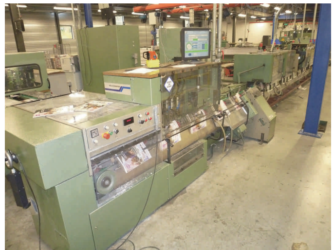
Vergaren, hechten en schoonsnijden. De SoftwareBus nadert zijn voltooiing

Nadat bepaald is wat er is en dus helder is wat er moet komen, gaan we de artikelen verwerven. Hierbij kunnen we gelukkig steeds een beroep doen op een aantal vaste schrijvers. Daarnaast krijgen we af en toe een artikel van een incidentele schrijver. Een deel van deze schrijvers heeft inspiratie genoeg en schrijft een stukje over wat hen bezig houdt, of waarover ze vragen hebben gekregen. Anderen kunnen geweldig goed schrijven, maar komen niet op gang zonder een hint.