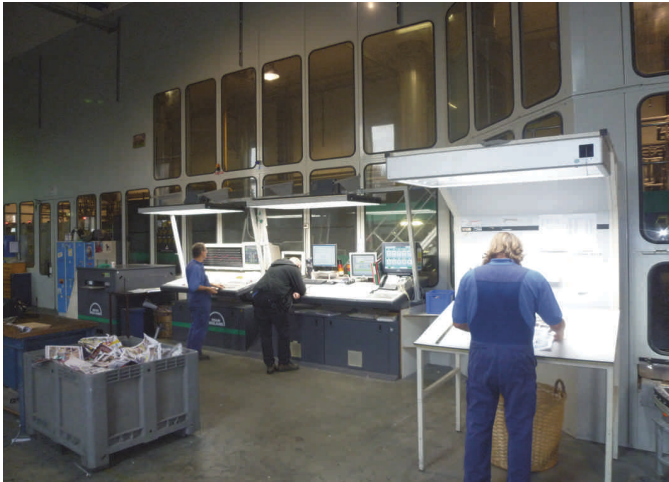
Controlere, controleren en nog eens controleren

de uitgave niet exact elke twee maanden plaatsvindt. Op basis van de verschijningsdatum vindt dan volgens goed Nederlands 'back scheduling' plaats, ofwel, we plannen terug op basis van de diverse activiteiten en de doorlooptijd daarvan, zodat we weten wanneer de sluitingsdatum van de kopij is. Zodra deze planning klaar is wordt die in het bestuur besproken. Ook wijzigingen op dit schema komen in het bestuur