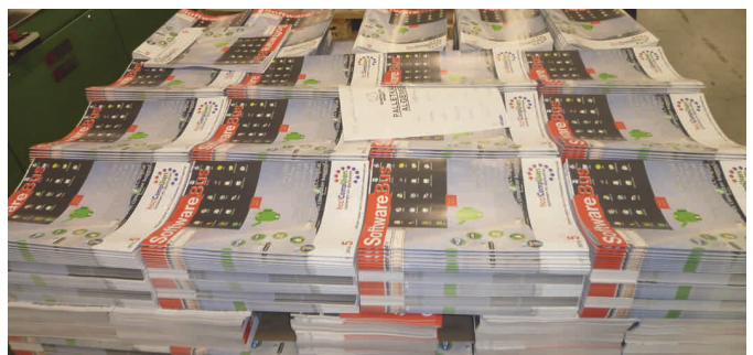
GigaHits erbij ... en dan op weg naar de abonnees

We willen altijd meer. Meer artikelen, meer artikelen op tijd. Het DTP-team is op sterkte, maar als er meer mensen mee willen doen, is daar ruimte voor. We zoeken nog mensen die mee willen denken over de inhoud en we zoeken vooral altijd mensen die willen schrijven. We hebben dus nog vacatures bij de redactie. We hebben het plan om als redactie zo'n twee à drie keer per jaar bijeen te komen, om met elkaar de gang van zaken binnen de redactie te bespreken en om zo te kijken wat er goed gaat en wat er beter kan. Want hoewel we elke keer trots zijn op het resultaat, vinden we ook elke keer weer zaken die beter kunnen. Met meer mensen is er meer mogelijk en we hebben een goed team, maar komen wel eens wat handjes te kort. Om u aan te melden kunt u contact opnemen met redactie@compusers.nl . Wilt u eerst nog wat daarover van gedachten wisselen. Ook dat kan, via hetzelfde adres, maar geef dan even aan dat u daarover met de hoofdredacteur wilt spreken. U kunt uiteraard ook direct mailen naar mijn privémailadres ( rene@renesuiker.nl ), maar daar blijft ook wel eens iets liggen ten gevolge van de grote drukte.