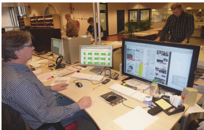
Alle binnengekomen bestanden worden vooraf gecontroleerd

De komende tijd kunt u dus verhalen verwachten rondom het bestuur, de redactie van de SoftwareBus, het previewersteam van de GigaHits, de activiteitencommissie, het webteam, de diverse Platforms en mogelijk nog meer. Maar we willen beginnen met de redactie van de SoftwareBus. Daarmee geven we de overige activiteiten al wat gelegenheid om na te denken over wat ze hierover te zeggen hebben.