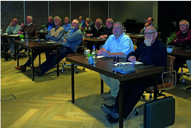
De ene helft van de aanwezigen ...

Voorheen, toen ik nog als vicevoorzitter actief was, regelde ik de inhoud van het programma. Dat heb ik zo lang gedaan dat het even wennen was om nu tot op de dag zelf in het ongewisse te zijn over het programma, maar het bracht ook wel rust. En er was uiteraard ook zonder mij weer een degelijk programma in elkaar gezet. En vandaag mocht ik dan gewoon deelnemen, hoefde ik niet bang te zijn om de boel te veel te sturen.