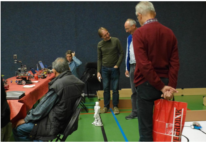
Platform Domotica toont een robot(je)

Zo waren dus de Platforms Windows, Domotica, DigiVideo (zelfs twee keer), DigiFoto (ook twee keer) en Muziek in staat om een lezing te verzorgen.