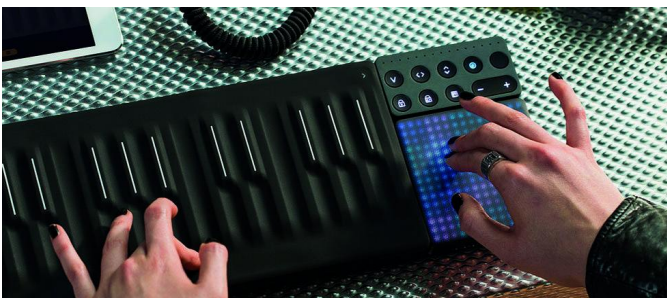
Roli-waveboard bij Platform Muziek

Zoals gebruikelijk had ons Platform Muziek weer een zaal voor zichzelf, waar de bezoekers uitstekende uitleg kregen over allerhande apparatuur en programmatuur op het gebied van muziek en computers. En vergis je niet, het gaat niet alleen maar om computermuziek, althans niet in de moderne zin van het woord, want ons Platform is gezegend met een