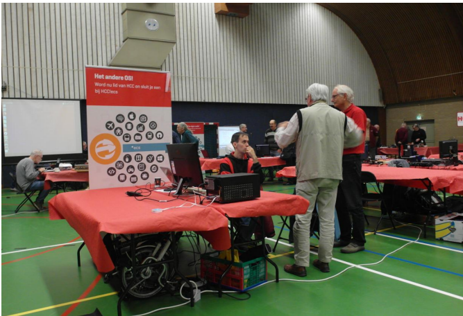
Interessegroep eCS (eComStation Operating System)

Voorwaar, genoeg redenen om naar De Bilt af te reizen. En in totaal zo'n 300 mensen namen in dit misschien wel laatste mooie weekend van 2018 de moeite om dat te doen.