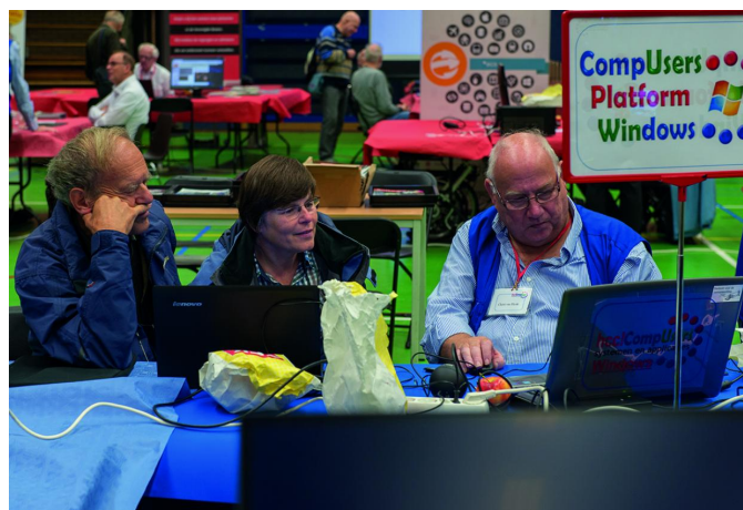
Uitleg aan de tafel van platform Windows

En 'last but not least': u kon hier nagenoeg de voltallige redactie ontmoeten of aan het werk zien met alweer de volgende (deze dus) uitgave van de SoftwareBus. Als u eens wilt zien hoe dat in zijn werk gaat, moet u echt een keer komen kijken.