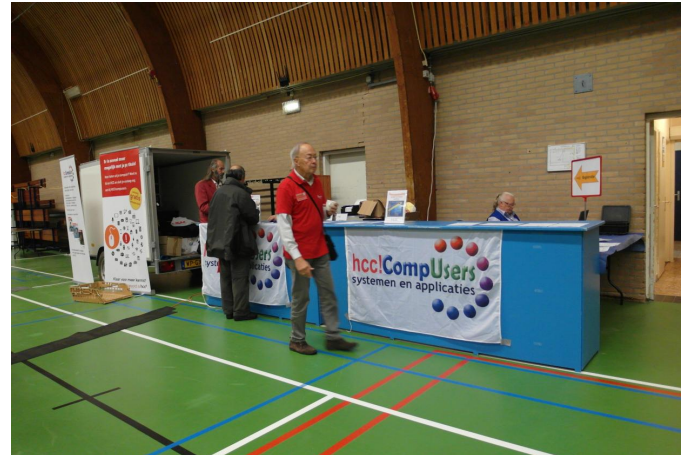
Een rustig moment aan de info-balie

Bij 'Mega' is onze grote zaal de sporthal van H.F. Witte. Daar hebben we heel veel ruimte, en zeker bij de Mega-variant is dat wel fijn, want naast onze eigen Platforms bieden we ook ruimte aan alle HCC-Interessegroepen. Centraal in dit alles is natuurlijk onze onvolprezen informatiebalie.