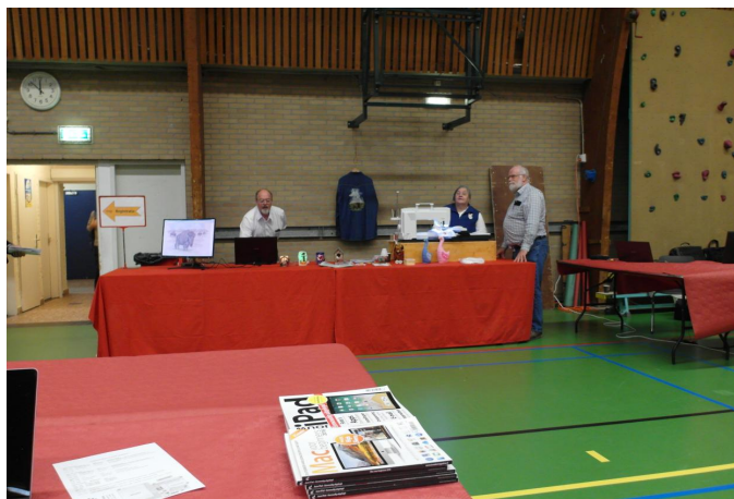
Voorgrond: leestafel met Apple-materiaal, achtergrond: Borduren-IG

Geen wonder, dat er steeds voldoende toeloop was. Wel vragen we ons af of al die besturing er nou de oorzaak van was dat de Wifi in de zaal het er maar moeilijk mee had. Aan de andere kant van de zaal waren de andere interessegroepen te vinden. Ik denk dat de Borduren-IG voor het eerst bij ons was; ik had ze in elk geval nog niet vaak gezien.