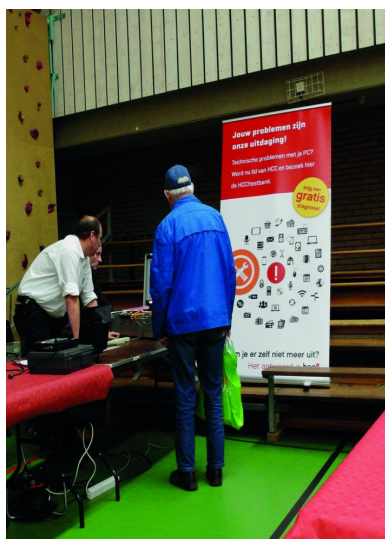
De hoek met de Testbank

We hadden ons Platform Domotica, dat uw huis 'smart' weet te maken. Dat gaat al veel verder dan de gordijnen dicht-