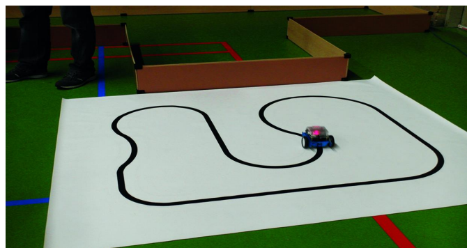
Er wordt gewerkt aan een veilig zelfrijdende auto

doen als het donker wordt. Er is op dat gebied al zo veel mogelijk wat het comfort kan verhogen en de kosten kan verlagen. Een echt moderne toepassing, die zeker geld kan opleveren. En erg enthousiast kunt u hierover worden voorgelicht. Verder een grote stand over Windows en over Linux; we hebben van beide verstand, maar dat geldt niet voor mij persoonlijk.