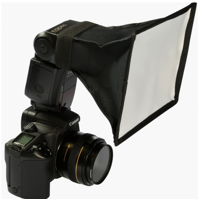
Voorbeeld van een opvouwbare softbox.

Het blijft dus alleszins gericht licht. Iets om rekening mee te houden.