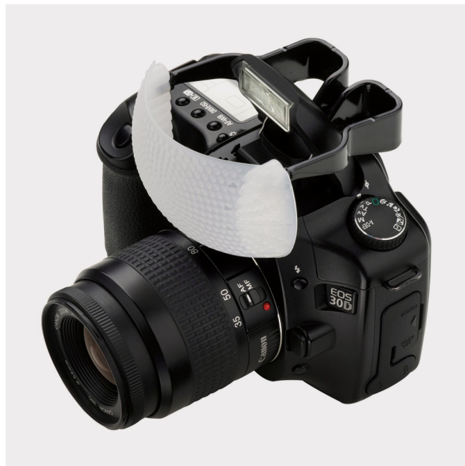
Enkele voorbeeld van zulke diffusoren die voor ingebouwde uitklapbare flitsers kunnen worden geplaatst.