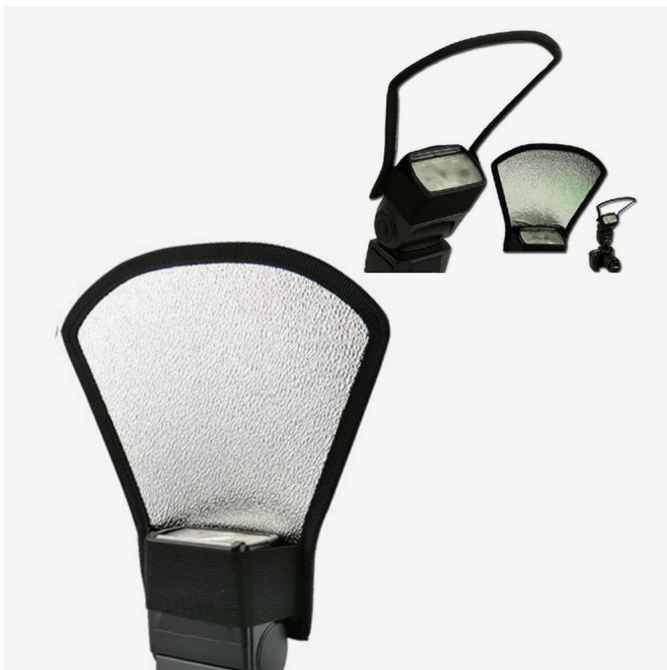
Boven en hiernaast: Voorbeelden van reflectieschermen.