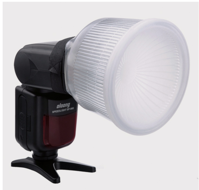
Voorbeeld van een bekervormige diffusor.

Deze diffusorkapjes bestaan al lang, maar hebben toch ook een ontwikkeling ondergaan. Sinds een aantal jaren is er een diffusor op de markt die een opmerkelijk betere werking heeft. Deze heeft een ronde (beker-)vorm, en is wat groter (vooral langer) uitgevallen dan de voornoemde kapjes. Ze kunnen het licht prachtig verzachten en slagschaduw fors verminderen. De professionele fotograaf die het huwelijk van mijn kinderen fotografeerde, maakte er actief gebruik van, en ik was aangenaam verrast over de resultaten. Ook voor deze bekervormige diffusor geldt dat de maat van de aanbrenghoek afhankelijk is van merk en type van de flitsers. Maar ik heb inmiddels ook universele types gezien, waarbij het aanbrenghoekstuk dat over de flitskop wordt geschoven van elastisch materiaal is, en dus op verschillende flitsers kan worden aangebracht. Het nadeel van deze bekervormige diffusor is dat die niet echt klein is - ongeveer zo groot als een lens. Maar de werking is best wel verrassend.