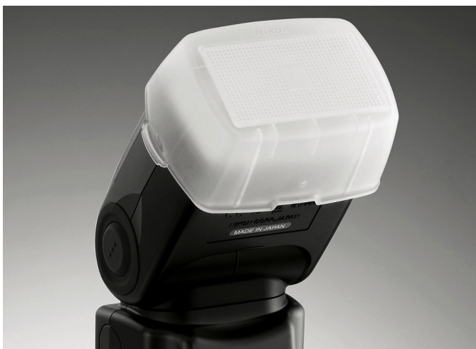
Voorbeeld van een vierkante diffusorkap.

Deze zie je in tal uitvoeringen. Meestal zijn ze rechthoekig van vorm, ongeveer gelijk aan de flitskop. Vanouds waren of zijn het kapjes van een melkwitte kunststof die over de flitskop worden geschoven. Om die reden zijn ze er in vele maten, afhankelijk van merk en type van de flitser. Sommige fabrikanten van flitsers leveren ze er standaard bij, of de flitsers zijn uitgevoerd met een uitklapbaar of uitschuifbaar diffusorplaatje. In de regel werken de los aan te brengen diffusorkapjes iets beter dan de ingebouwde. Verwacht ook van deze middelen geen wonderen, ofschoon er uiteenlopende meningen over nut en noodzaak zijn. Veel beroepsfotografen, vooral persfotografen, zweren erbij, terwijl anderen ze verzuizen.