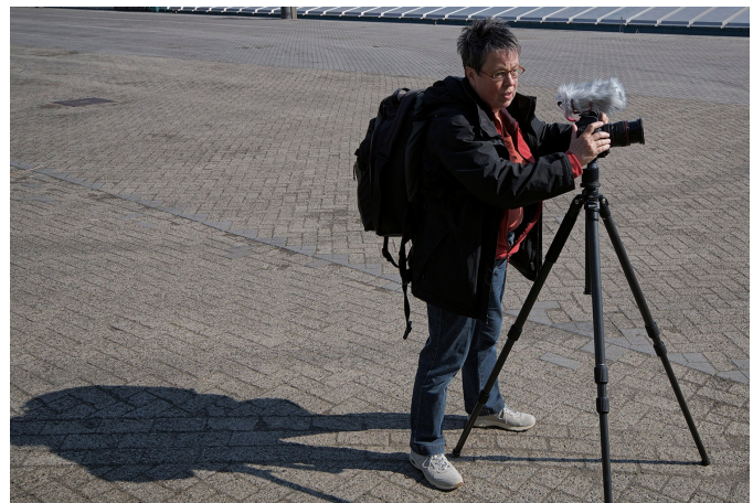
De auteur tijdens haar eerste poging: alle begin is moeilijk.

Na het filmen volgt dan de montage met het toevoegen van geluid. Dat is technisch niet zo moeilijk, inhoudelijk wel. Het kost veel tijd, ook als je ervaring hebt. Allerlei formaten en resoluties komen voor, afhankelijk van fototoestel, montageprogramma, en wat je met de film wilt gaan doen, zoals versturen via de smartphone, op CD of internet zetten. Ook daar moet je je weg in vinden. Hoe dat moet? Dat is een ander verhaal.