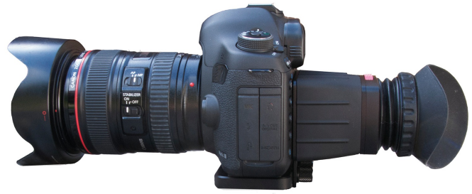
Camera met view finder (rechts)

Filmen kost veel opslagruimte, de opslagkaartjes moeten niet alleen voldoende groot, maar ook snel zijn. Filmen kost ook veel energie, waardoor extra batterijen nodig zijn. Wil je een 'echte' film maken, dan ontkom je niet aan het bewerken van alle beelden die je hebt opgenomen. Daar heb je