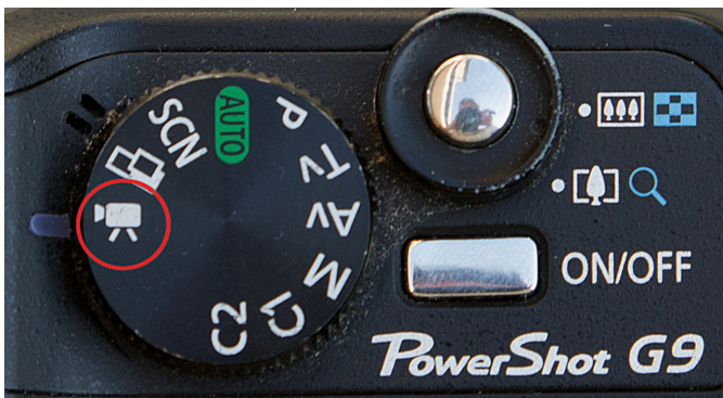
Fotocamera op filmstand

In 2008 bracht Canon de EOS 5D Mark II uit. Deze camera heeft een revolutionaire filmfunctie, met een grote sensor en de mogelijkheid verwisselbare objectieven te gebruiken. De resultaten zijn zó goed dat het een geduchte concurrent werd van de heel dure filmcamera's. Filmers gingen ertoe over deze fotocamera te gebruiken om hun film op te nemen. Daarnaast gebruiken steeds meer fotografen de filmfunctie van hun camera om, naast het maken van foto's, ook te filmen.