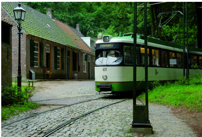
De museumtram. Een geliefd vervoersmiddel én foto-object

Na aankomst bij het museum en tijdens de voorpret onder genot van koffie en oud-Hollands appelgebak werden wat groepjes gevormd, voor degenen die de voorkeur gaven aan een bepaald type fotografie. Al snel waaierden de deelnemers uit over het grote museumterrein, maar de nog vrij nieuw opgezette Jordaanse buurt bleek een geliefd start- en fotopunt te zijn. En daarna mocht graag de historische tram worden genomen naar een andere fotolocatie. Waarbij de trams en de conducteurs zelf ook geliefde foto-objecten bleken.