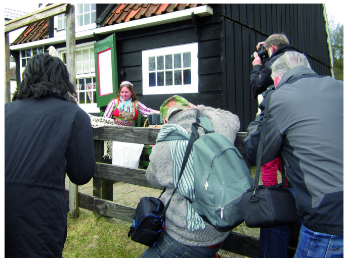
De deelnemers zijn zelf het onderwerp geworden

Ook grappige momenten werden vastgelegd; zie de geslaagde shots van Isja Nederbragt en van Tjaha Dharmaperwira, waarbij een aantal deelnemers zelf op ludieke wijze zijn ver-eeuwigd. En ten slotte - heel goed - lieten sommigen ook grensverleggende fotografie zien.